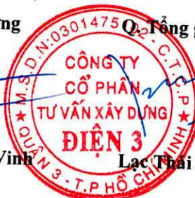
Lạc Thái Phước