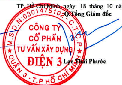
Lạc Thái Phước