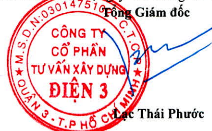
Lạc Thái Phước