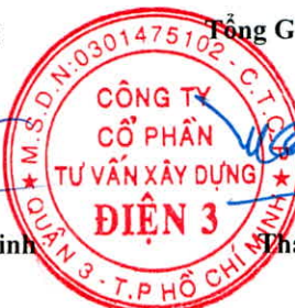
Thái Tuấn Tài