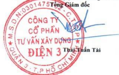
Thái Tuấn Tài