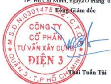
Thái Tuấn Tài