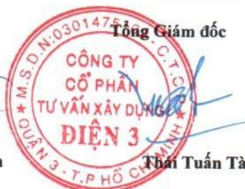
Trần Tuấn Tài