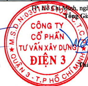
Thái Tuấn Tài