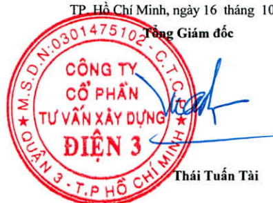
Thái Tuấn Tài