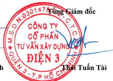
Thái Tuấn Tài