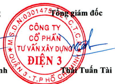
Thái Tuấn Tài