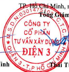
Thái Tuấn Tài